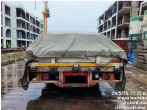
รูปที่ 10 ผ้าใบปิดคลุมท้ายรถบรรทุก