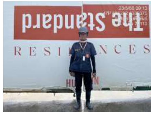
รูปที่ 17 เจ้าหน้าที่รักษาความปลอดภัย (รปภ.)