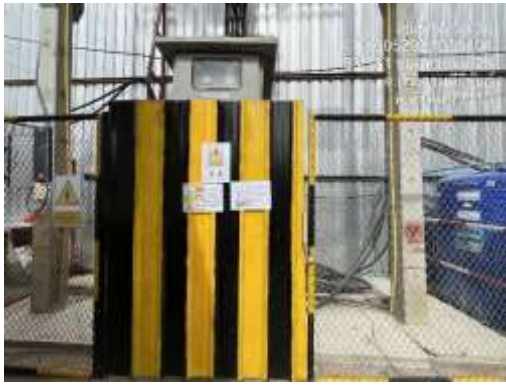
รูปที่ 27 ช่างเทคนิคดูแลระบบไฟฟ้า