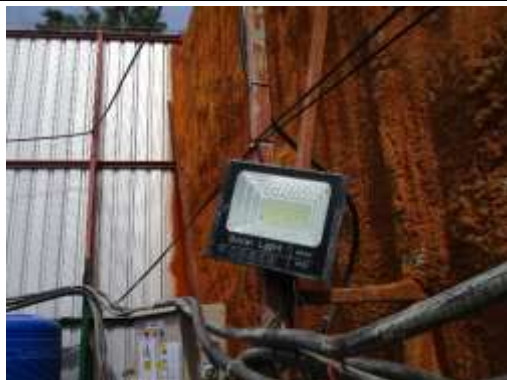
รูปที่ 7 ไฟฟ้าส่องสว่าง