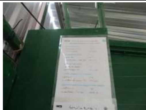
รูปที่ 52 เบอร์ติดต่อฉุกเฉิน