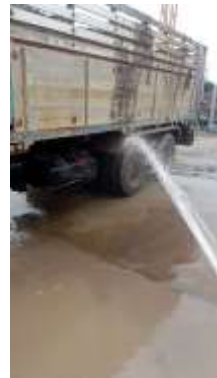
รูปที่ 15 คนงานทำความสะอาดล้อรถบรรทุก