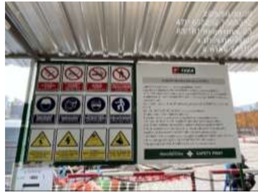
รูปที่ 28 ทุกระเบียบพื้นที่ก่อสร้าง