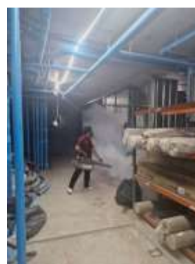
รูปที่ 64 ฉีดพ่นควั่นกำจัดยุงลาย