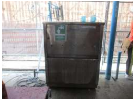
รูปที่ 39 น้ำดื่ม