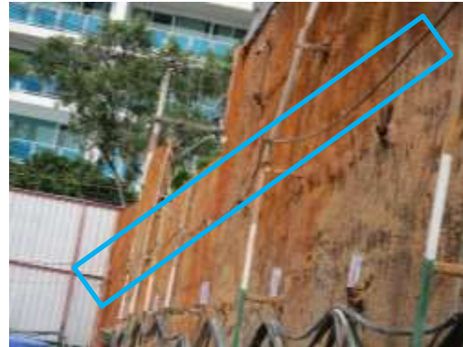
รูปที่ 11 สเปรย์น้ำ