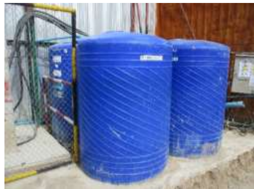
รูปที่ 20 ถังสำรองน้ำ