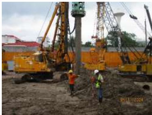
รูปที่ 19 การเจาะเสาเข็ม