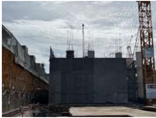
รูปที่ 43 ผ้าใบกันฝุ่น (Mesh sheet)