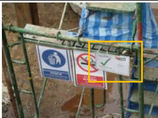
รูปที่ 47 ใบอนุญาตให้ใช้งานนั่งร้าน