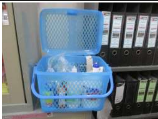
รูปที่ 51 อุปกรณ์ปฐมพยาบาล