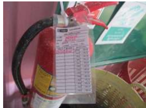
รูปที่ 30 ถังดับเพลิง