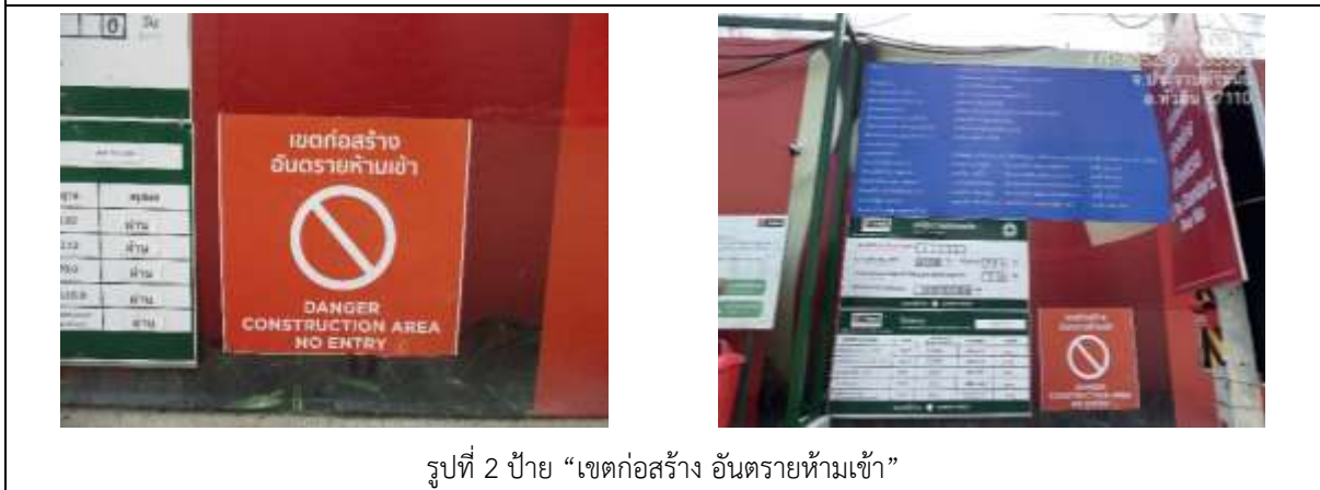
รูปที่ 2 ป้าย “เขตก่อสร้าง อันตรายห้ามเข้า”