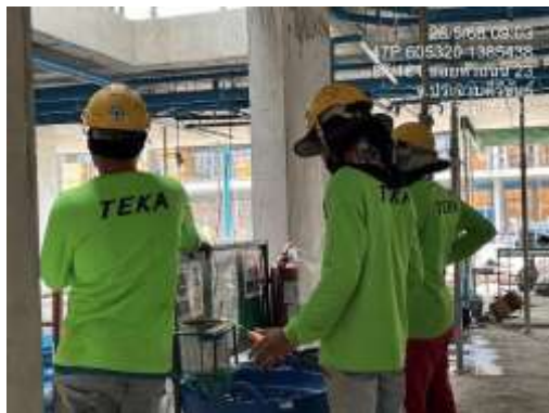
รูปที่ 29 พื้นที่สูบบุหรี่