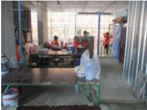
รูปที่ 38 พื้นที่พักคนงานช่วงเวลากลางวัน