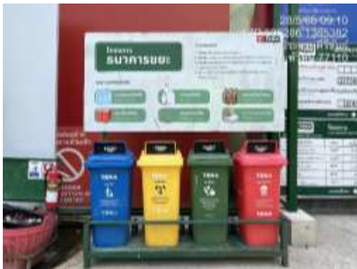
รูปที่ 18 ถังรองรับมูลฝอย