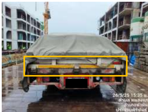
รูปที่ 45 แผ่นป้ายสะท้อนแสง