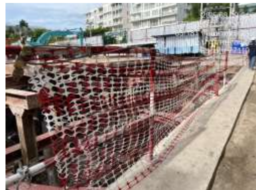
รูปที่ 6 ราวกันตก