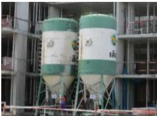
รูปที่ 12 ถังไฮโดรปอน