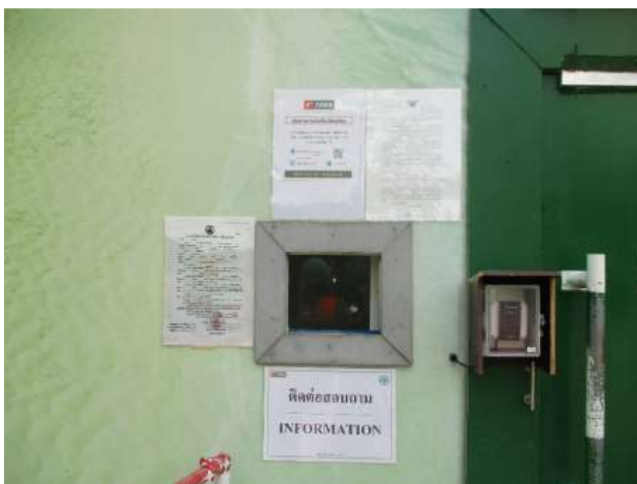
รูปที่ 53 เอกสารผ่านความเห็นชอบจากสำนักงานนโยบายและแผนทรัพยากรธรรมชาติและสิ่งแวดล้อม ตามเลขที่ ทส 1009.5/24155 ลงวันที่ 27 ธันวาคม 2567 และใบอนุญาตก่อสร้าง (อ.1)