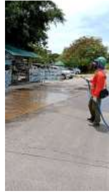
รูปที่ 9 คนงานทำความสะอาดถนนด้านหน้าโครงการ