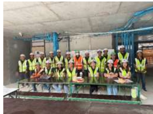
รูปที่ 5 วิศวกรควบคุมการก่อสร้าง