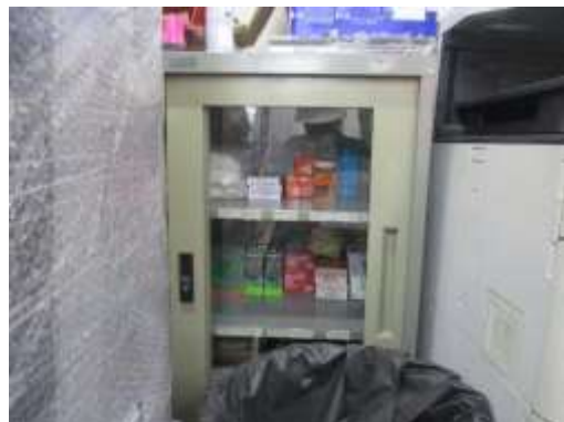
รูปที่ 41 อุปกรณ์ปฐมพยาบาลเบื้องต้น