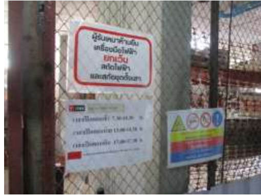
รูปที่ 37 พื้นที่จัดเก็บวัตถุไวไฟ