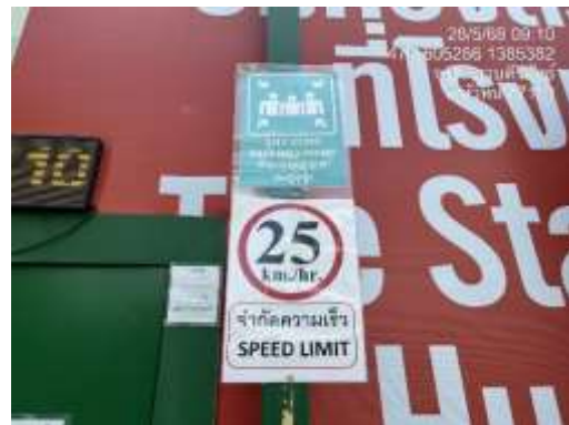
รูปที่ 46 ป้ายจำกัดความเร็ว