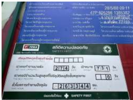
รูปที่ 40 ป้ายสถิติความปลอดภัย