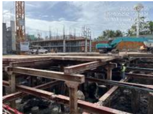
รูปที่ 42 ระบบค้ำยันเหล็ก (Bracing)