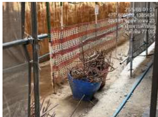
รูปที่ 13 พื้นที่จัดเก็บเศษวัสดุ