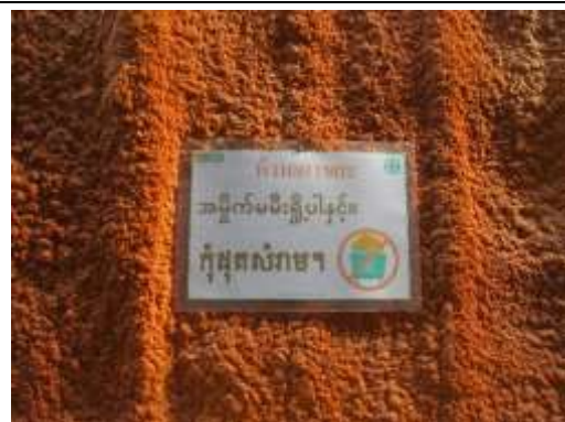
รูปที่ 50 ป้ายห้ามเผาขยะ