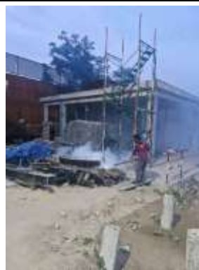
รูปที่ 62 เจ้าหน้าที่ฉีดพ่นยุงลาย