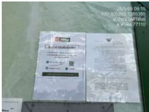
รูปที่ 4 ช่องทางการรับเรื่องร้องเรียน