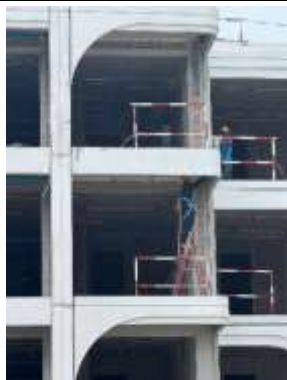
รูปที่ 21 คนงานสวมใส่อุปกรณ์ป้องกันอันตรายส่วนบุคคล