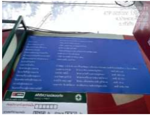
รูปที่ 3 ป้ายรายละเอียดโครงการ