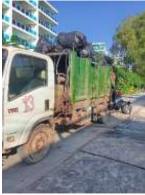
รูปที่ 36 รถจัดเก็บขยะมูลฝอย