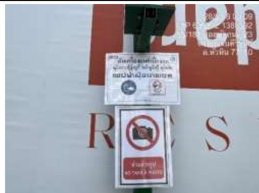
รูปที่ 48 ป้ายดับเครื่องยนต์เมื่อจอด