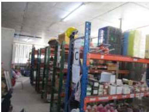
รูปที่ 31 ห้องสโตร์