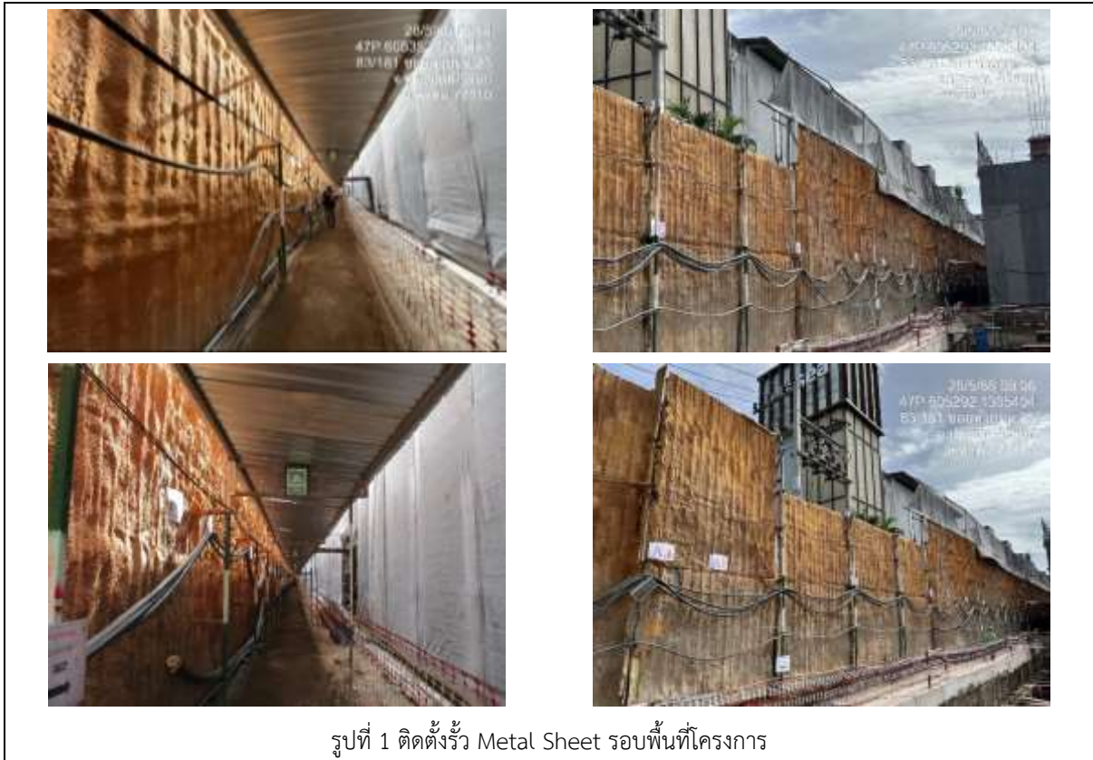
รูปที่ 1 ติดตั้งรั้ว Metal Sheet รอบพื้นที่โครงการ