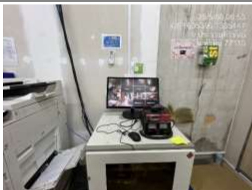
รูปที่ 49 ห้องควบคุม CCTV