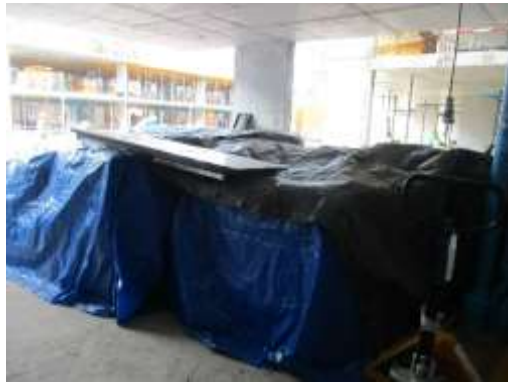
รูปที่ 16 ผ้าใบปิดคลุมวัสดุก่อสร้าง