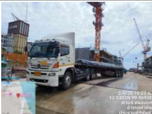
รูปที่ 32 พื้นที่จอดรถขนส่งวัสดุก่อสร้าง