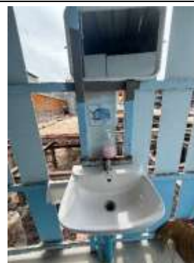
รูปที่ 63 ป้ายรณรงค์ประหยัดน้ำ