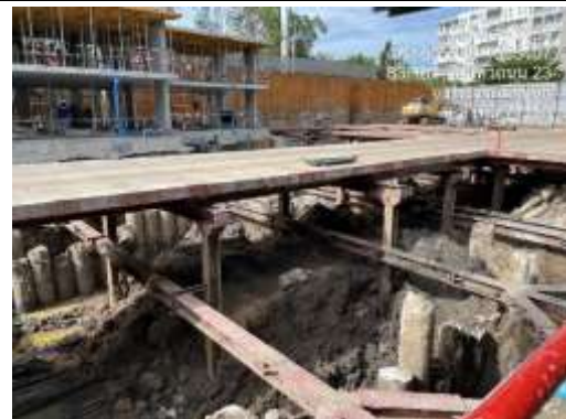
รูปที่ 33 แผ่นเหล็กสำหรับทางวิ่งรถ