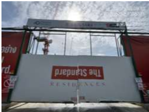
รูปที่ 14 ประตูทางเข้า-ออกโครงการ