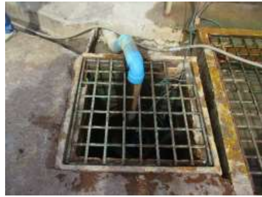
รูปที่ 44 บ่อตกตะกอน