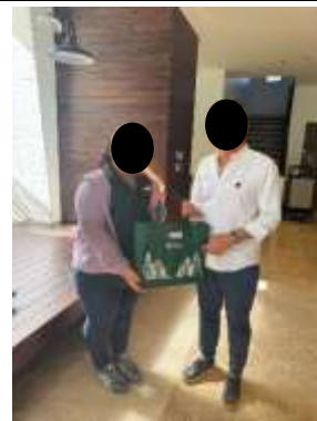
รูปที่ 8 เจ้าหน้าที่เข้าพบผู้พักอาศัยข้างเคียง